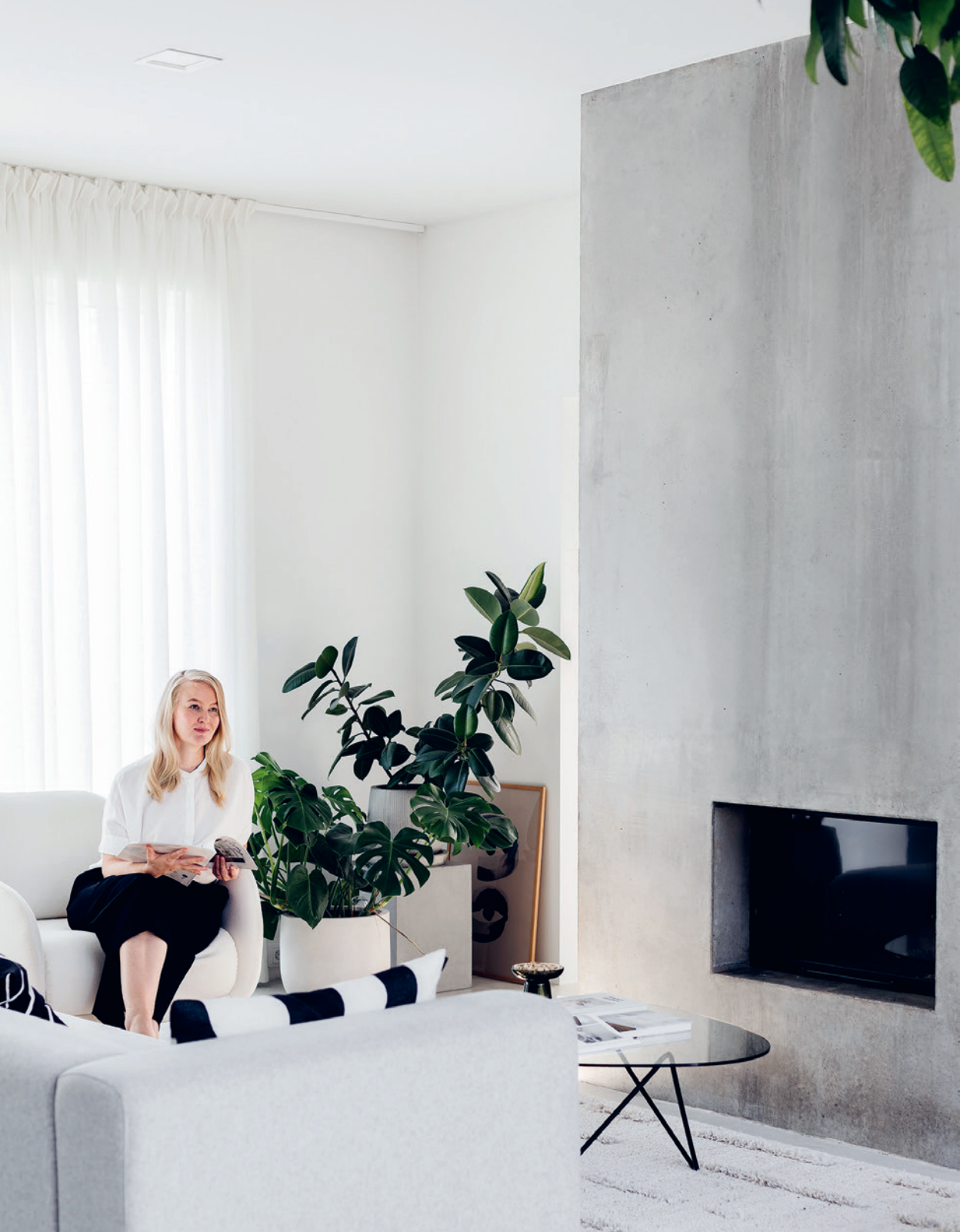
Maaretta Tukiainen: Hyvän mielen koti Näytesivut kirjasta