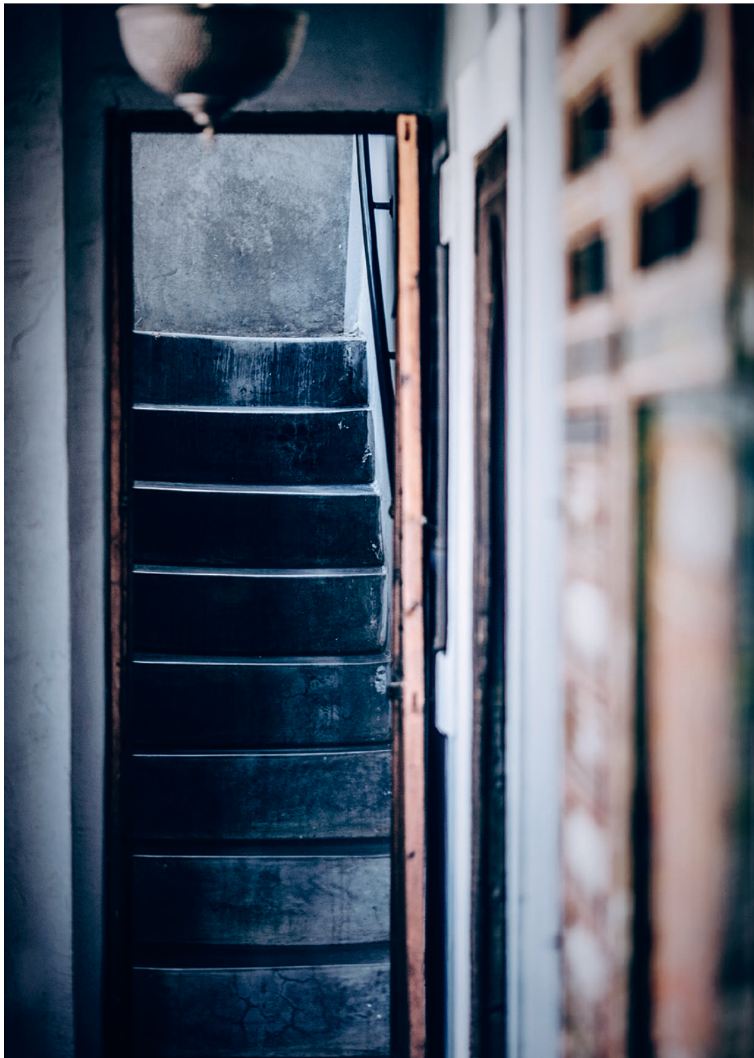
Maaretta Tukiainen: Hyvän mielen koti Näytesivut kirjasta