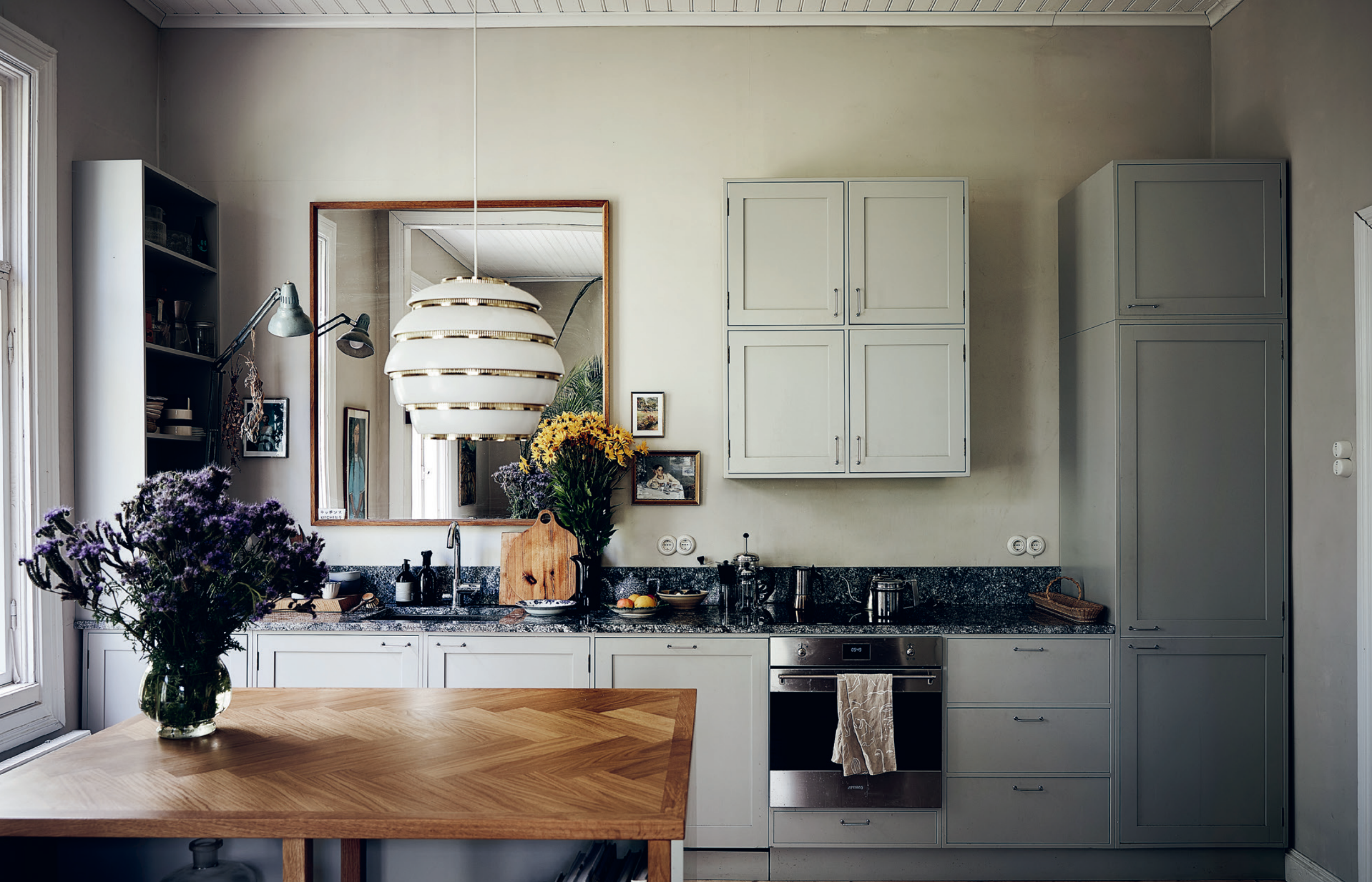
Maaretta Tukiainen: Hyvän mielen koti Näytesivut kirjasta