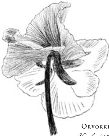
ORVOKKI Viola (suku)

3 Mikä luonnossa tuo sinulle eniten iloa? Entä rauhaa?