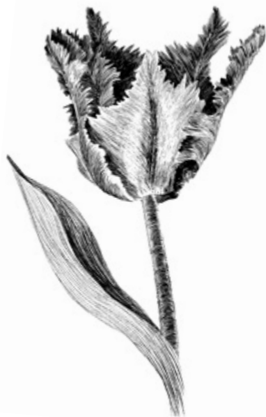
PAPUKAIJATULPPAANI Tulipa 'Black Parrot'