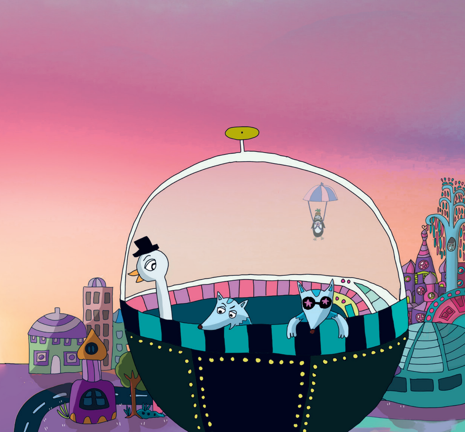
Petra Raivonen: Satukielen ihan pötkö katoaminen Näytesivut kirjasta